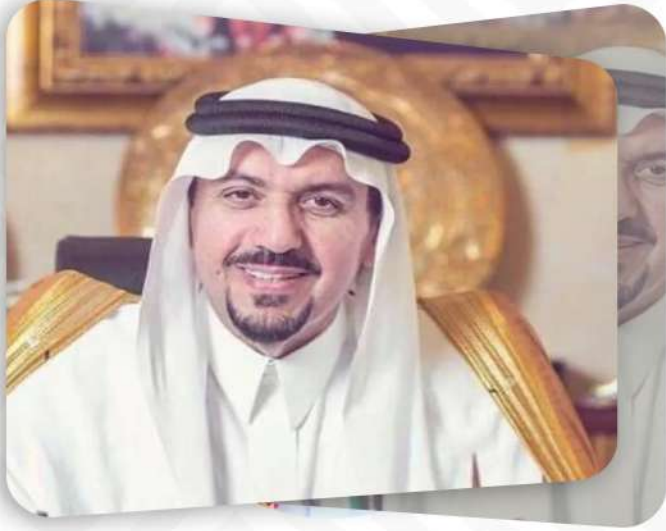
صاحب السمو الملكي الدكتور

فَيْصَلُ بْنُ فَصَّالِ بْنِ سَعُودِ بْنِ عَبْدِ الْعَزِيزِ السَّعُودِ أمير منطقة القصيم