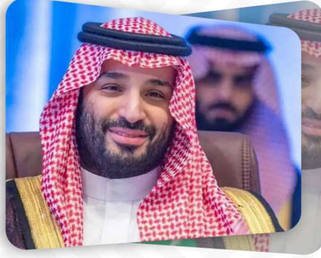
صاحب السمو الملكي ولي العهد

فَيْصَلُ بْنُ فَصَّالِ بْنِ سَعُودِ بْنِ عَبْدِ الْعَزِيزِ السَّعُودِ أمير منطقة القصيم